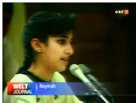
Die Brutkastenlüge: »Krankenschwester« Nayirah vor dem US-Kongress, 1991

Die Schlüsselfigur war damals John E. Porter, der den Kongressausschuss leitete und gleichzeitig mit der PR-Agentur kooperierte. Angesichts solcher Kollusion forderte selbst die CFR-affine New York Times Konsequenzen – und die gab es tatsächlich: Porter wurde kurz darauf in den Council gewählt.