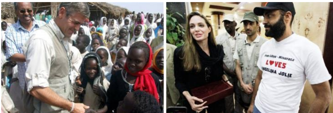
Clooney 2012 im (Süd-)Sudan, Jolie 2011 in Libyen.

Doch nicht nur Filmstudios, auch einige der bekanntesten Hollywood-Stars sind Mitglied im CFR und engagieren sich für dessen internationale Projekte. Wenn Angelina Jolie nach Libyen fliegt, um mit den NATO-Revolutionären Solidarität zu zeigen und sie für ihren Einsatz zu loben , oder wenn George Clooney sich (der hungernden Kinder wegen) für die Aufspaltung des (ötreichen und China-freundlichen) Sudans unter US-Aufsicht einsetzt , dann berichten CFR-Medien ausführlich darüber – und erwähnen dabei nur eines nicht: dass diese Schauspieler ebenfalls Mitglieder des Councils sind.