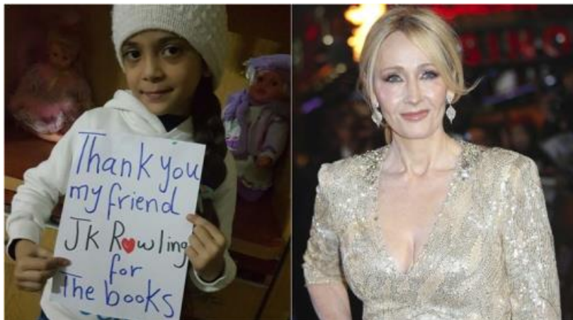
Danke für die Bücher: »Bana Alabed« und J.K. Rowling, Syrienkrieg, 2016.

Als der Auslandschef einer Schweizer Wochenzeitung diese und andere Kriegslügen Mitte der 1990er Jahre einem deutschsprachigen Publikum darlegen wollte, intervenierten sogleich bekannte Medienhäuser aus Deutschland und der Schweiz bei seinem Verleger und sorgten dafür, dass er zu Bosnien vorläufig nichts mehr schreiben durfte und gar seine Absetzung diskutiert wurde .