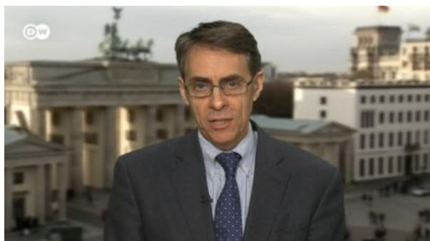
HRW-Direktor und CFR-Mitglied Kenneth Roth auf der Deutschen Welle

Im Syrienkrieg hatte Human Rights Watch nach dem Giftgasangriff vom Sommer 2013 alsbald ein Gutachten zur Hand, welches die Täterschaft der syrischen Regierung belegen und damit eine NATO-Intervention begründen sollte. In einer späteren Analyse von MIT-Forschern stellte sich das Gutachten indes als fabriziert heraus, doch für CFR-Medien dürfte dies auch künftig kein Grund zur Skepsis sein.