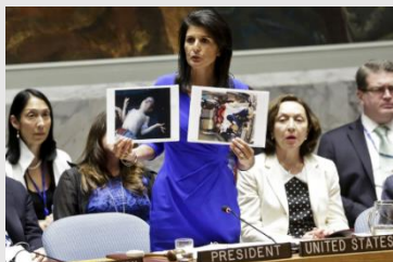
Die amerikanische UNO-Botschafterin präsentiert Bilder von Opfern eines angeblichen Giftgas-Angriffs der syrischen Regierung; April 2017.

Weshalb publiziert die UNO einen solch fragwürdigen Bericht? Womöglich deshalb, weil die federführende UNO-Abteilung für Politische Angelegenheiten von einem US-Diplomaten geleitet wird, der zuvor in der Besatzungsbehörde für den Irak (CPA) diente , während die von der UNO mit der Untersuchung beauftragte Organisation für das Verbot chemischer Waffen (OPCW) von einem türkischen Diplomaten geführt wird, der zuvor NATO-Funktionär (und Bilderberg-Teilnehmer) war . Auch UNO-Berichte sind mithin stets kritisch zu prüfen – zumal CFR-Medien diese Arbeit aus naheliegenden Gründen kaum übernehmen werden.