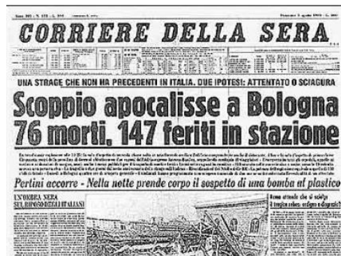
Anschlag auf den Bahnhof von Bologna, 1980: Eine Gladio-Operation

Das Besondere an Geheimdiensten wie der CIA ist indes, dass sie nicht nur in der Gewinnung und Verarbeitung von Information tätig sind, sondern auch verdeckte Operationen durchführen. So organisierten britische und amerikanische Geheimdienste zusammen mit der NATO während des Kalten Kriegs Dutzende Bombenanschläge in Westeuropa, die sodann kommunistischen und arabischen Gruppierungen angelastet wurden ( Operation Gladio ). CFR-Medien verbreiteten dabei stets das offizielle Narrativ und stellten keine kritischen Fragen – ein Mechanismus, der sich bis heute beobachten lässt.