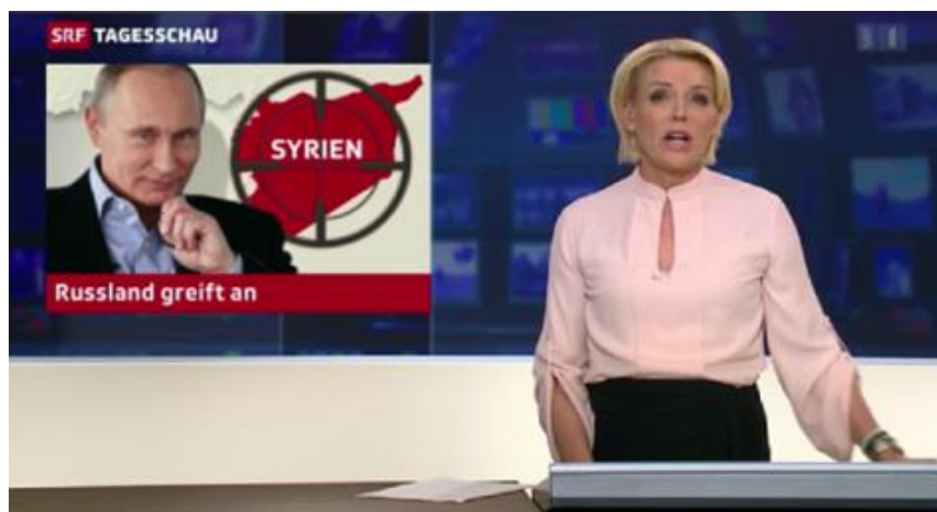
NATO-konform: Die Tagesschau des Schweizer Fernsehens SRF

In geopolitischen bzw. imperialen Angelegenheiten berichten mithin auch die etablierten Schweizer Medien weitgehend CFR- und NATO-konform . Begünstigt wird diese Konformität durch die zunehmende Medienkonzentration, die dazu führte, dass inzwischen über 90% des Schweizer Marktes von nur fünf Medienhäusern kontrolliert werden. Die strukturelle Einbindung dieser Verlage erfolgt dabei primär über die Bilderberg-Gruppe sowie über zunehmend enge Kooperationen mit deutschen Atlantikbrücke-Medien.