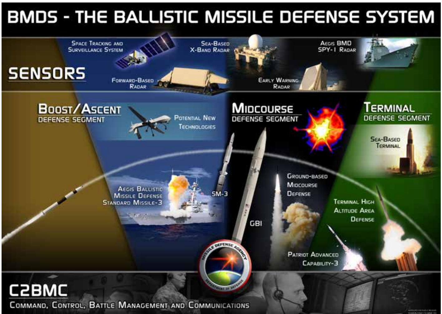
Überblick über das Ballistic Missile Defense System (BMDS) der USA (Darstellung der Missile Defense Agency (MDA), 2010)

eine Machbarkeitsstudie („Missile Defense Feasibility Study“) erteilt. Ergebnis der geheimen über 10.000seitigen Studie war, dass ein solcher flächendeckender Schild prinzipiell technisch realisierbar sei und Kosten zwischen 27,5 und 30 Milliarden Euro, mit den notwendigen Frühwarnsatelliten 40 Milliarden oder mehr, verursachen werde. 49 Beim NATO-Gipfel im April 2008 wurde dann beschlossen, „Optionen für eine umfassende Raketenabwehrarchitektur zu entwickeln, um den Abdeckungsbereich auf das gesamte Bündnisgebiet und alle Bevölkerungen zu erstrecken, die nicht anderweitig durch das US-System abgedeckt sind“. 50 Auf dem NATO-Gipfel in Lissabon im November 2010 folgte schließlich die endgültige Entscheidung: „Wir werden daher [...] die Fähigkeit entwickeln, unsere Bevölkerungen und Gebiete gegen einen Angriff mit ballistischen Flugkörpern als ein Kernelement unserer kollektiven Verteidigung zu verteidigen [...] Wir werden aktiv die Zusammenarbeit mit Russland und anderen euro-atlantischen Partnern in der Raketenabwehr anstreben“, hieß es im dort verabschiedeten neuen Strategischen Konzept. 51