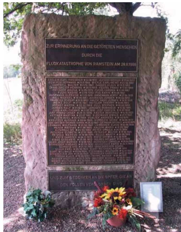
Ramstein Memorial zur Flugkatastrophe 1988

Von hier aus werden Einsätze auf dem afrikanischen Kontinent koordiniert, wegen vielfältiger geostrate-