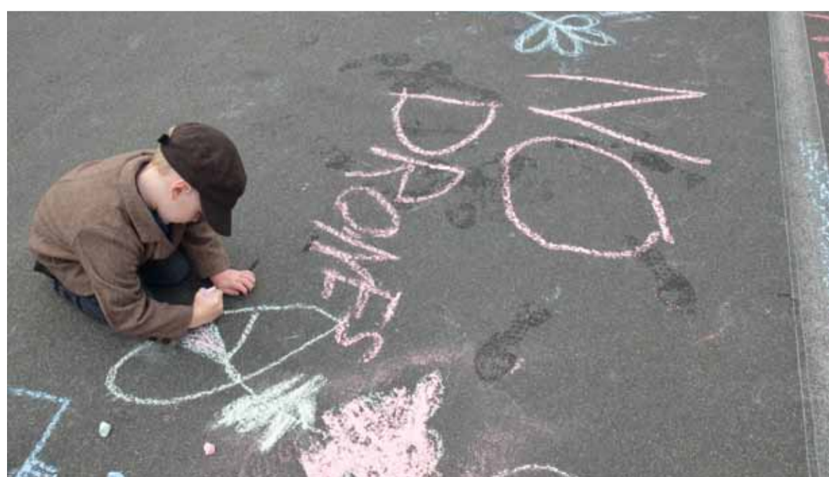
Proteste gegen Drohnen in den USA