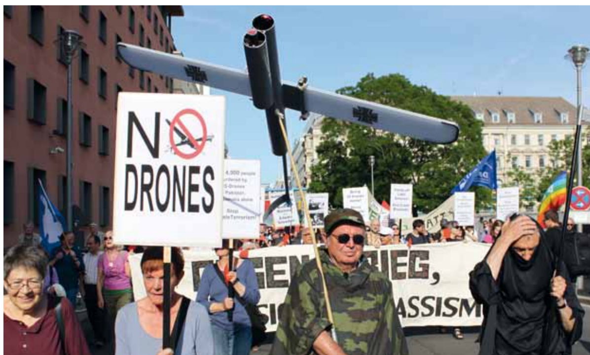
Protest gegen Drohnen und Krieg in Berlin

Aktionsbüro Ramstein-Kampagne | Marienstraße 19/20 | 10117 Berlin Tel.: 030 20 65 48 57 | Fax: 030 31 99 66 89 | Mail: info@ramstein-kampagne.eu